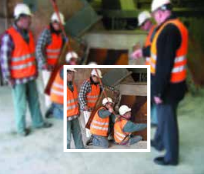
Safety training on the procedures for working in confined areas at Jura Cement, Wildegg facility.