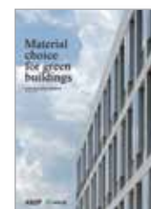
Sostenibilidad con el concreto