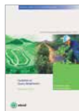
Impactos locales sobre la tierra y las comunidades