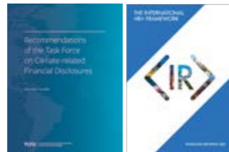
Radna skupina za klimatska financijska izvješća

Ovakvom integracijom eksternalija potaknut će se konstruktivni razgovori s vladama i ostalim dionicima o razvoju uloge gospodarstva u društvu.