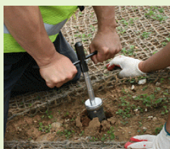
Gathering soil sample

Como parte de la restauración progresiva de la cantera de cemento Halle cerca de Backdudaegan en Corea, un programa piloto de rehabilitación fue creado para cubrir un área de 17 hectáreas para determinar el mejor método para la restauración. El ensayo de tres años determinó el tipo de flora nativa que mejor se ajustaba a la geología y las condiciones climáticas y las mejores metodologías