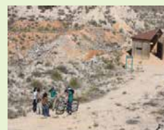
Bird observation hide

La cantera se extiende sobre 200 hectáreas en Castilla la Mancha (Toledo, España). Las colinas semiáridas están dominadas por arbustos y olivos, incluidos tomillo, roble y pastizales con carrasca. Dos especies endémicas protegidas han sido identificadas en el área. La compañía ha creado alianzas con una universidad para los temas de sucesión ecológica y educación; con el WWF en España para temas de comunicación y siembra de árboles; con la asociación local de ciclismo a campo traviesa, y con ingenieros de restauración ecológica. Este programa ha creado un campo de observación botánico y de aves, tramos para ciclistas, un centro de educación y facilita muchos programas de investigación. Las visitas han sido diseñadas para compartir y diseminar el conocimiento sobre las especies de plantas y aves en niños de colegio.