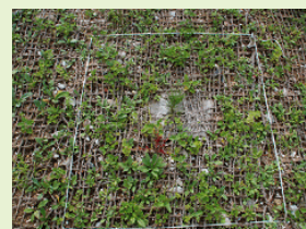
Install regular form to check survival curve

Cada año, cerca de 13 500 árboles nativos son plantados. El proyecto es visitado anualmente por 2500 estudiantes, como parte de su programa de entrenamiento, y los ciudadanos locales participan en el manejo del bosque que cubre nueve hectáreas.