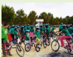
Educational programs for schools

La cantera se extiende sobre 200 hectáreas en Castilla la Mancha (Toledo, España). Las colinas semiáridas están dominadas por arbustos y olivos, incluidos tomillo, roble y pastizales con carrasca. Dos especies endémicas protegidas han sido identificadas en el área. La compañía ha creado alianzas con una universidad para los temas de sucesión ecológica y educación; con el WWF en España para temas de comunicación y siembra de árboles; con la asociación local de ciclismo a campo traviesa, y con ingenieros de restauración ecológica. Este programa ha creado un campo de observación botánico y de aves, tramos para ciclistas, un centro de educación y facilita muchos programas de investigación. Las visitas han sido diseñadas para compartir y diseminar el conocimiento sobre las especies de plantas y aves en niños de colegio.